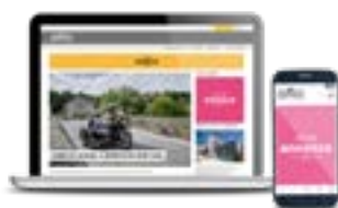
Annonces en ligne