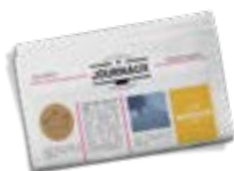
Annonces dans la presse fribourgeoise

Quel que soit la situation vous avez le bon canal de diffusion pour votre message.