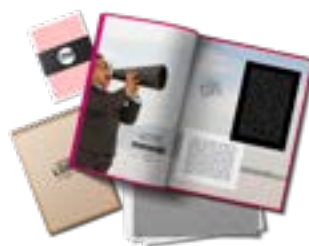
Impressions tous supports