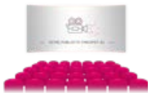
Annonces sur grand écran