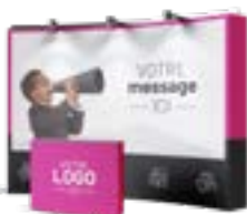
Supports imprimés pour événements

CONSEILS SUR-MESURE VISIBILITÉ OPTIMALE SUPPORTS DE COMMUNICATION PERTINENTS