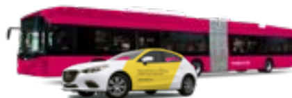
Marquage de véhicules et vente d'emplacements