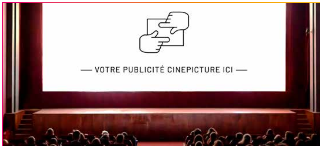
IMAGE FIXE DIFFUSÉE DURANT 7 SECONDES SANS LE SON