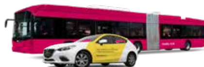
Marquage de véhicules et vente d'emplacements